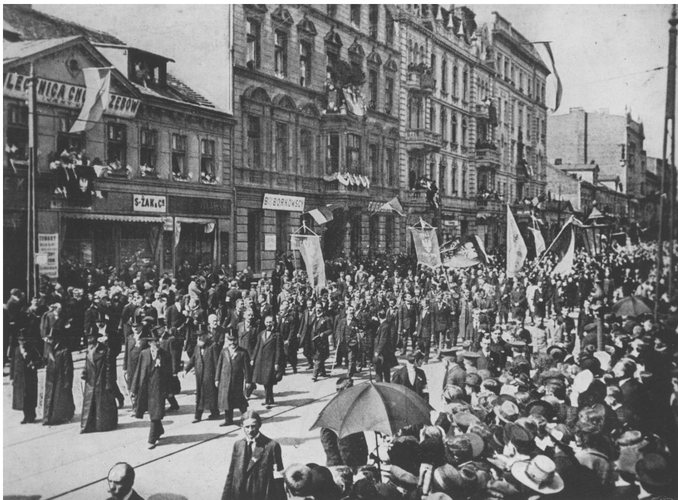
Ulica Piotrkowska 3 maja 1916 r., fot. NAC