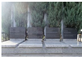
Zbiorowa mogiła lotników poległych w walkach nad Łodzią we wrześniu 1939 r. zlokalizowana na cmentarzu wojskowym pw. św. Jerzego na Dołach w Łodzi