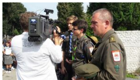
Piocki Hufiec Harcerzy (ZHR)