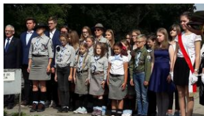
Hufiec ZHP PŁOCK im. Obrońców Płocka 1920 roku