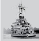
Pancernik „Schleswig-Holstein” | Westerplatte