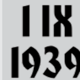
1 IX 1939 Początek II wojny światowej