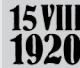
15 VIII 1920 Bitwa Warszawska 1920 r.