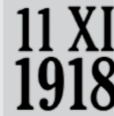
11 XI 1918 Odzyskanie niepodległości