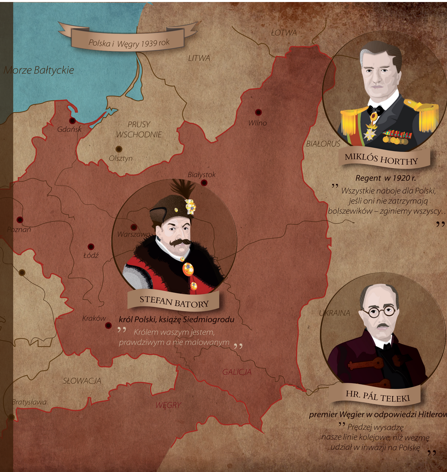
Polska i Węgry 1939 rok