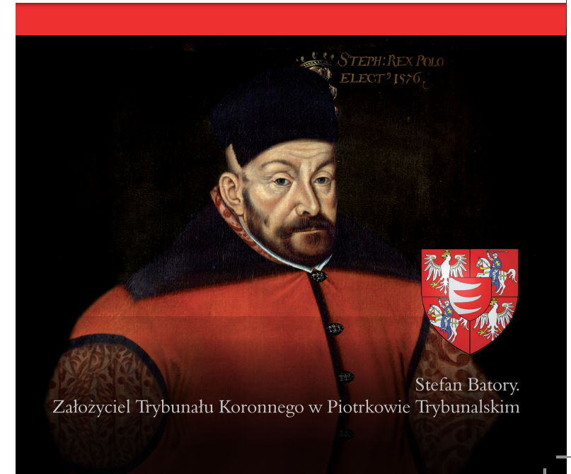
Stefan Batory. Założyciel Trybunału Koronnego w Piotrkowie Trybunalskim

Muzeum w Piotrkowie Trybunalskim 23 marca 2017 r., godz. 10.00