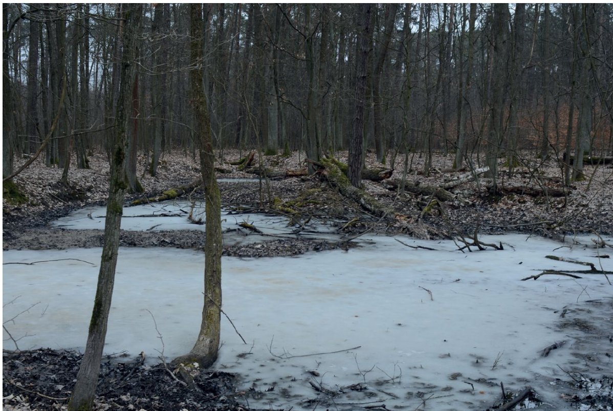
Las Lućmierski (wiosna 2018), fot. Olgierd Ławrynowicz

na terenie poligonu wojskowego na Brusie w Łodzi.