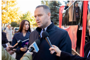
Piotrków Trybunalski 10_10_2022-5