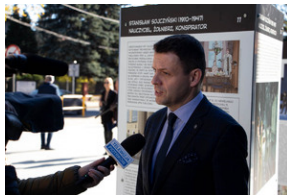
Piotrków Trybunalski 10_10_2022-9