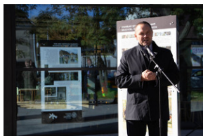
Piotrków Trybunalski 10_10_2022-11