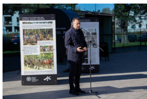
Piotrków Trybunalski 10_10_2022-14