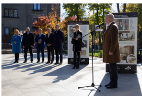
Piotrków Trybunalski 10_10_2022-13