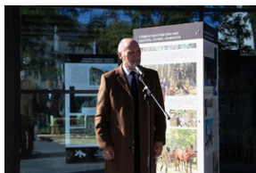
Piotrków Trybunalski 10_10_2022-12