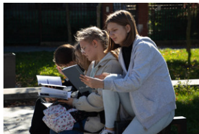
Piotrków Trybunalski 10_10_2022-8