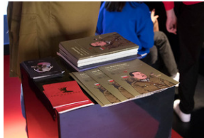
Piotrków Trybunalski 10_10_2022-3