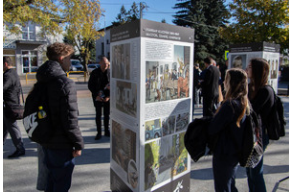
Piotrków Trybunalski 10_10_2022-19