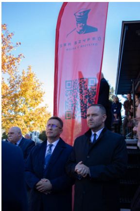
Piotrków Trybunalski 10_10_2022-7