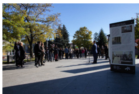
Piotrków Trybunalski 10_10_2022-15