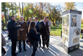
Piotrków Trybunalski 10_10_2022-18