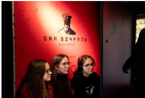
Piotrków Trybunalski 10_10_2022-4