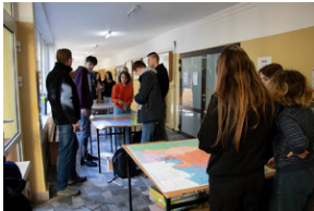
Piotrków Trybunalski 10_10_2022