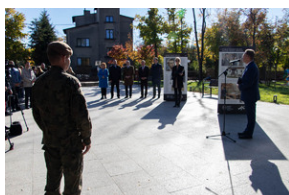
Piotrków Trybunalski 10_10_2022-17