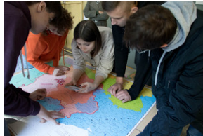
Piotrków Trybunalski 10_10_2022-2