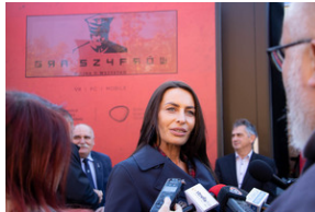
Piotrków Trybunalski 10_10_2022-6