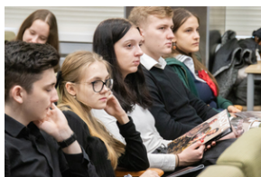
77 rocznica stracenia Stanisława Sojczyńskiego Warszyc _ promocja komiksu 19 _02_2024-0195