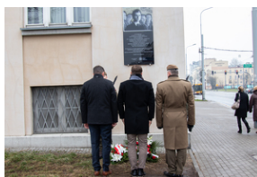
77 rocznica stracenia Stanisława Sojczyńskiego Warszyc _ promocja komiksu 19 _02_2024-0153