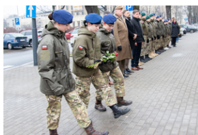
77 rocznica stracenia Stanisława Sojczyńskiego Warszyc _ promocja komiksu 19 _02_2024-0161