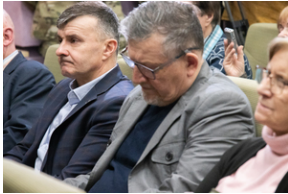
77 rocznica stracenia Stanisława Sojczyńskiego Warszyca _promocja komiksu 19 _02_2024-0224