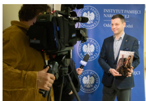
77 rocznica stracenia Stanisława Sojczyńskiego Warszyc _ promocja komiksu 19 _02_2024-0179