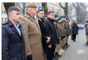
77 rocznica stracenia Stanisława Sojczyńskiego Warszyc _ promocja komiksu 19 _02_2024-0173