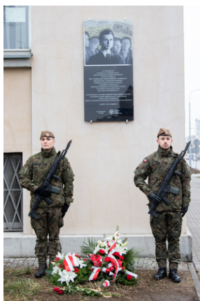
77 rocznica stracenia Stanisława Sojczyńskiego Warszyc _ promocja komiksu 19 _02_2024-0169