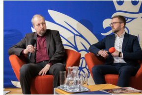
77 rocznica stracenia Stanisława Sojczyńskiego Warszyca _promocja komiksu 19 _02_2024-0227