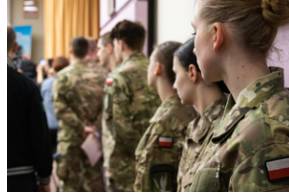
77 rocznica stracenia Stanisława Sojczyńskiego Warszyca _promocja komiksu 19 _02_2024-0213