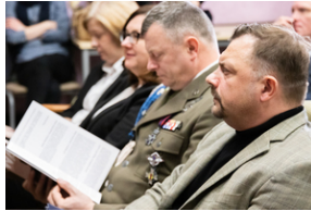
77 rocznica stracenia Stanisława Sojczyńskiego Warszyca _promocja komiksu 19 _02_2024-0222