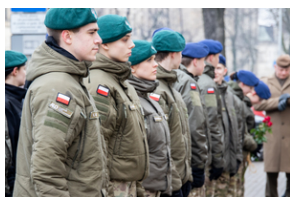
77 rocznica stracenia Stanisława Sojczyńskiego Warszyc _ promocja komiksu 19 _02_2024-0130

19 lutego br. w sali konferencyjnej Wojewódzkiej Biblioteki Publicznej im. Marszałka Józefa Piłsudskiego w Łodzi odbyła się prezentacja najnowszej publikacji łódzkiego Oddziału IPN - komiksu „Warszyc”.