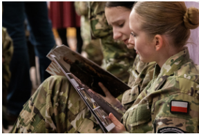
77 rocznica stracenia Stanisława Sojczyńskiego Warszyca _promocja komiksu 19 _02_2024-0237