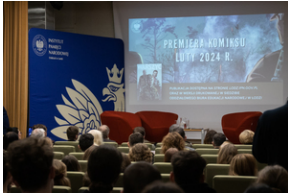
77 rocznica stracenia Stanisława Sojczyńskiego Warszyca _promocja komiksu 19 _02_2024-0217