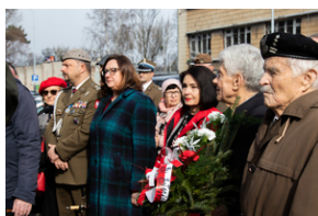
Narodowy Dzień Pamięci Żołnierzy Wyklętych 01_03_2024-0437