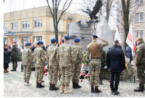
Narodowy Dzień Pamięci Żołnierzy Wyklętych 01_03_2024-0499