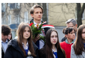
Narodowy Dzień Pamięci Żołnierzy Wyklętych 01_03_2024-0425