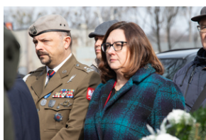
Narodowy Dzień Pamięci Żołnierzy Wyklętych 01_03_2024-0412