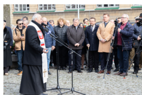
Narodowy Dzień Pamięci Żołnierzy Wyklętych 01_03_2024-0452