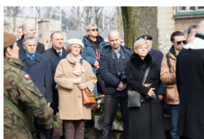
Narodowy Dzień Pamięci Żołnierzy Wyklętych 01_03_2024-0453