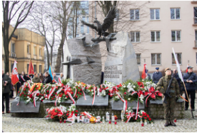
Narodowy Dzień Pamięci Żołnierzy Wyklętych 01_03_2024-0509