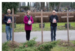
Narodowy Dzień Pamięci Żołnierzy Wykolejonych BUWiM 01_03_2024-1442