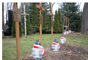
Narodowy Dzień Pamięci Żołnierzy Wykolejonych BUWiM 01_03_2024-1459