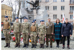
Narodowy Dzień Pamięci Żołnierzy Wyklętych 01_03_2024-0523