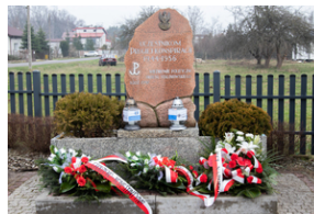
Narodowy Dzień Pamięci Żołnierzy Wyklętych 01_03_2024-0388