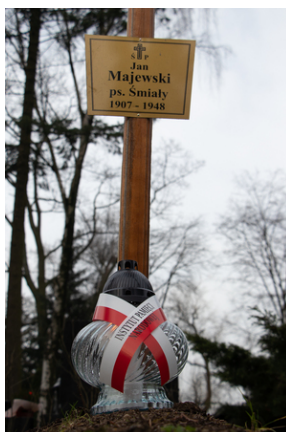
Narodowy Dzień Pamięci Żołnierzy Wykolejonych BUWiM 01_03_2024-1463