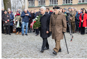
Narodowy Dzień Pamięci Żołnierzy Wyklętych 01_03_2024-0476