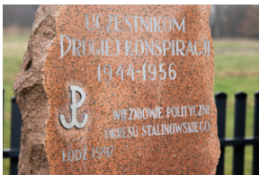
Narodowy Dzień Pamięci Żołnierzy Wyklętych 01_03_2024-0357