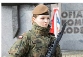
Narodowy Dzień Pamięci Żołnierzy Wyklętych 01_03_2024-0423