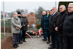
Narodowy Dzień Pamięci Żołnierzy Wyklętych 01_03_2024-0395