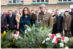
Narodowy Dzień Pamięci Żołnierzy Wyklętych 01_03_2024-0471