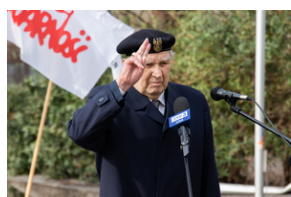
Narodowy Dzień Pamięci Żołnierzy Wyklętych 01_03_2024-0429