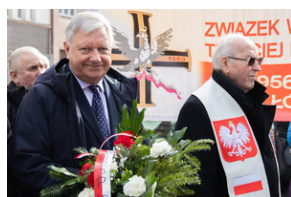
Narodowy Dzień Pamięci Żołnierzy Wyklętych 01_03_2024-0415