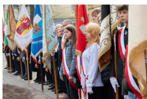
Narodowy Dzień Pamięci Żołnierzy Wyklętych 01_03_2024-0450