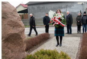
Narodowy Dzień Pamięci Żołnierzy Wyklętych 01_03_2024-0377