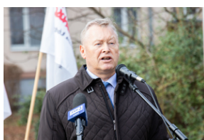
Narodowy Dzień Pamięci Żołnierzy Wyklętych 01_03_2024-0434