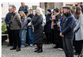
Narodowy Dzień Pamięci Żołnierzy Wyklętych 01_03_2024-0448