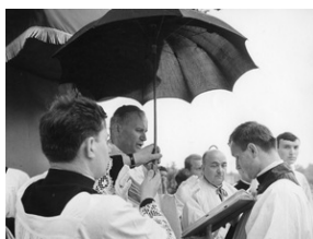
Pokaż opis pliku IPN Ld-16-2-2-16 Obchody milenium Tysiąclecia Chrztu Polski w diecezji