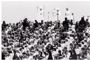
Pokaż opis pliku IPN BU-7-7-8-476 Msza święta na lotnisku Lublinek w czasie wizyty Jana Pawła II w Łodzi 13 czerwca 1987 r.