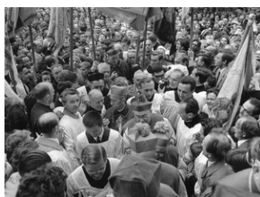
Pokaż opis pliku IPN Ld-16-2-2-17 Obchody milenium Tysiąclecia Chrztu Polski w diecezji