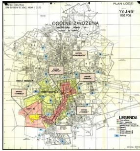
Pokaż opis pliku IPN BU 1585/3042, Ogólne założenia zabezpieczenia pobytu Jana Pawła II na terenie m. Łodzi w dniu 13.06.1987 r. Plan Łodzi.